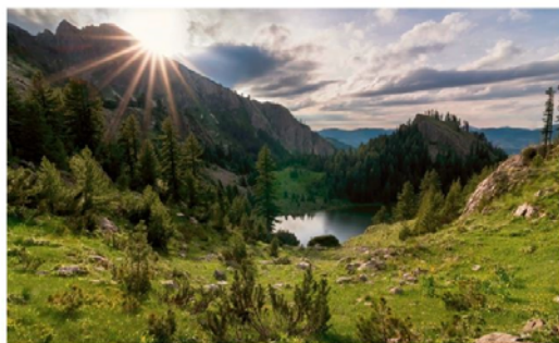
Blick auf den wildromantischen Nationalpark am Ende des Rugova-Tals.

Kosovo fiel bisher vor allem als Unruheherd auf. Die aufregende Kultur und Natur des jüngsten Staates Europas warten auf Touristen.